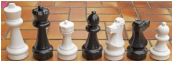
TERRASSENSCHACH weiß/schwarz, KH: 310 mm